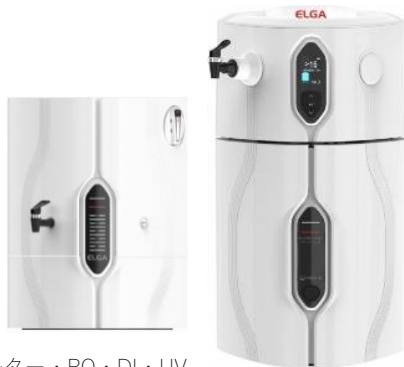
純化工程：プレフィルター・RO・DI・UV