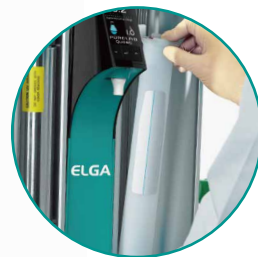
カートリッジ交換イメージ

少量使用に最適化したカートリッジです コンパクトなカートリッジ 1 本で 18.2 MΩ・cm の超純水を製造可能 ランニングコストを大きく削減できます 交換はワンタッチ、ディスプレイの指示通りに作業するだけです 交換目安は期間ではなく、ディスプレイに表示される水質が変動しはじめたら交換です